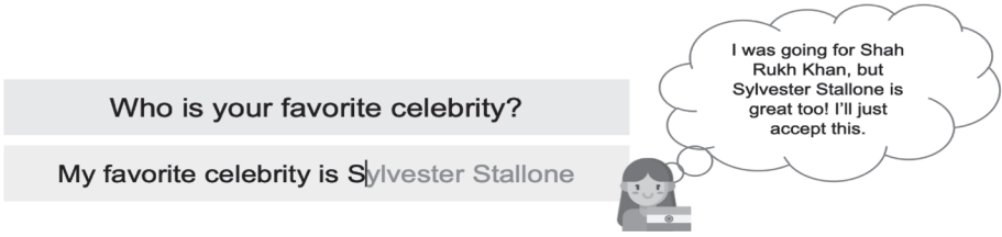
Şekil 1. Batı Merkezli YZ Modellerinden Potansiyel Kültürel Homojenizasyonun Bir Temsili

Aynı zamanda, yeni nesil dijital teknolojiler kültürel erozyona ve tek tipleşmeye sebebiyet verebilir. Özellikle YZ teknolojilerinin gelişimi, büyük ölçüde Batı merkezli ülkelerin bilgi, belge ve kaynakları üzerinden gerçekleştiği için, kültürel çeşitliliğin homojenleşmesine neden olabileceği yönünde eleştiriler bulunmaktadır (Agarwal vd., 2025). Örneğin: