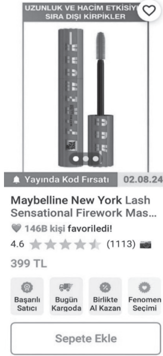
Görsel-1: Araştırma kapsamında incelenen ürün

Tablo 1'e bakıldığında, takipçi sayısına göre ünlü etkileyici (celebrity) dışındaki diğer kategorilerden etkileyiciler kullanıldığı görülmektedir. Ünlü etkileyici kategorisinden herhangi bir Türk etkileyicilerden yararlanılmamıştır. Bunun yerine daha sonradan etkileyici olan kişilerden faydalanılmıştır. Türkiye'de gösterilen reklamlarda yerli ünlü kullanımına gidilmeyerek yabancı ünlü ve Türk etkileyiciler kullanılmıştır. Buradan yola çıkılarak etkileyicilerin ne denli güçlü olduğu, kültür endüstrisi düzeninde yerlerinin ne kadar sağlam ve etkili olduğuna ulaşılabilmektedir.